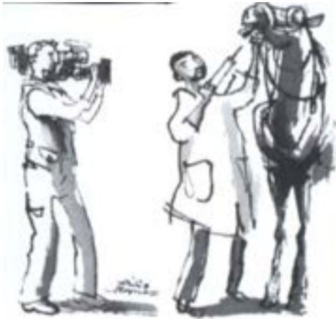
Illustratie: Philip Hopman